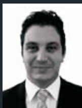
Director do Departamento de Estruturas