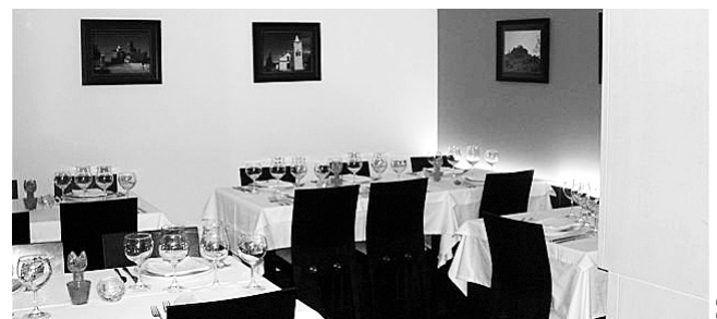
O RESTAURANTE D. Sesnando, em Penela

O preço por casal é de 38 euros. Para reservas e informações estão disponíveis os telemóveis 96 470 46 36, 96 401 67 97, ou e-mail d.sesnando@netcabo.pt. |