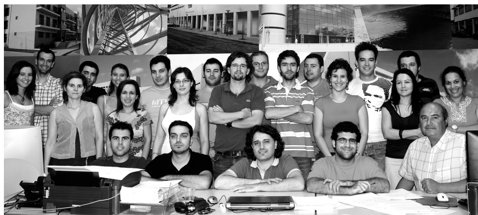
A EQUIPA da Central Projectos é composta por especialistas em diferentes áreas

Trata-se da primeira certificação da empresa na área da Qualidade e os seus resultados são visíveis ao nível do reconhecimento e posição que a empresa ocupa no