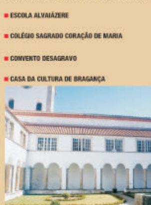
PÁTIO DA INQUISIÇÃO