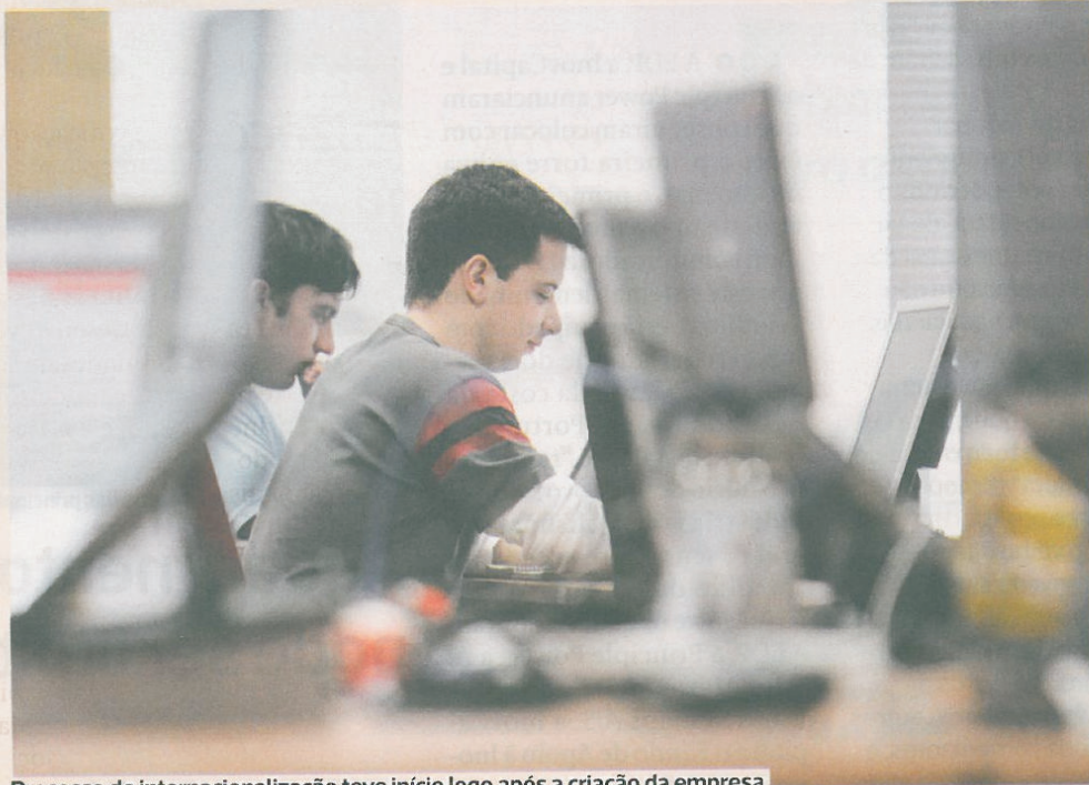
Processo de internacionalização teve início logo após a criação da empresa

Foram várias as empresas que se juntaram à campanha, da qual o DIÁRIO AS BEIRAS é também parceiro. O Pingo Doce da Figueira da Foz ofereceu mais alguns bens alimentares, a juntar aos recolhidos pela Verallia; a Saicapack ofereceu as caixas/cabazes onde serão colocados os alimentos; a Foz Gráfica – Sociedade Gráfica Figueirense deu os autocolantes de promoção da campanha; a Mookito – Creative Solutions realizou todo o trabalho de design; e a Octágono – Comunicação Digital ficou responsável pela criação do site da iniciativa, alojado em www.sgmondogo.com/ .